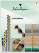
▼ FU 500 / FN 500