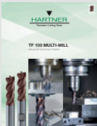
▼ TF 100 MULTI-MILL