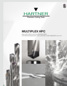
▼ MULTIPLEX HPC